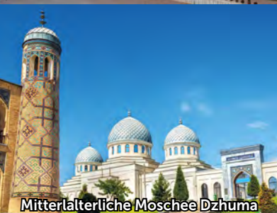
Mittelalterliche Moschee Dzhuma