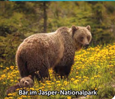
Bär im Jasper-Nationalpark

Ein Roadtrip per Motorrad durch das Herz von Westkanada und die majestätischen Rocky Mountains ermöglicht Ihnen das vollkommene Eintauchen in atemberaubende Landschaften. Zwischen türkisblauen Seen und funkelnden Gletschern, unendlichen Nadelwäldern, tosenden Wasserfällen und goldenen Canyons entfaltet jeder Tag eine Kulisse, die eines grossen Abenteuerfilms würdig wäre.