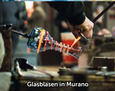
Glasblasen in Murano