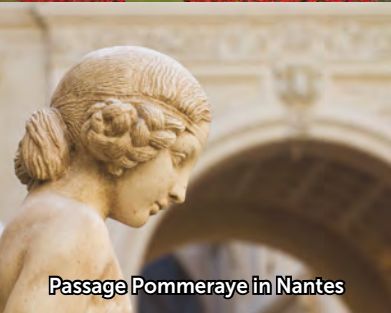
Passage Pommeraye in Nantes