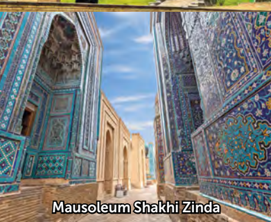
Mausoleum Shakhi Zinda

Die Magie der alten Seidenstrasse ist noch immer lebendig! Um diesen Zauber zu erleben, begeben wir uns mit dem Orient Silk Road Express auf eine aussergewöhnliche Zugreise durch vier Länder: Usbekistan, Tadschikistan, Kirgisistan und Kasachstan. Wir entdecken atemberaubende Landschaften, geschichtsträchtige Städte, UNESCO-Weltkulturerbe und charmante lokale Traditionen. Diese Reise hält viele Überraschungen bereit: eine Fahrt auf dem Issyk-Kul-See – es ist der zweitgrösste Bergsee der Welt – sowie den Besuch des Kalyan-Minarets in Buchara, der Stadt mit dem Leuchtturm in der Wüste, die legendäre Gastfreundschaft der Usbeken und vieles mehr... Ein einzigartiges und unvergessliches Erlebnis.