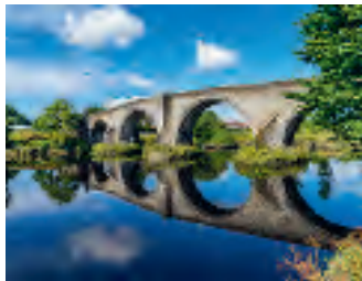
Geschichte trifft Landschaft – die Stirling Bridge – ein Freiheitssymbol.

Ideal für alle, die in gut einer Woche einen Eindruck von Schottland bekommen wollen und dabei gerne zweimal an jedem Ort übernachten wollen. Die Fahrdistanzen sind relativ kurz gehalten. Und trotzdem lernen Sie sowohl das ländliche, abwechslungsreiche Zentral- und Südschottland kennen wie auch die pulsierenden Städte Edinburgh und Glasgow.