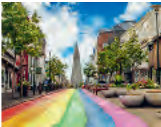
Reykjavik ist die nördlichste Hauptstadt der Welt.

Erkunden Sie Islands bekannteste Sehenswürdigkeiten wie den Geysir und die schwarzen Sandstrände an der Südküste. Ebenfalls auf dem Programm stehen die Halbinsel Snæfellsnes «Island en miniature», sowie die Hauptstadt Reykjavík.