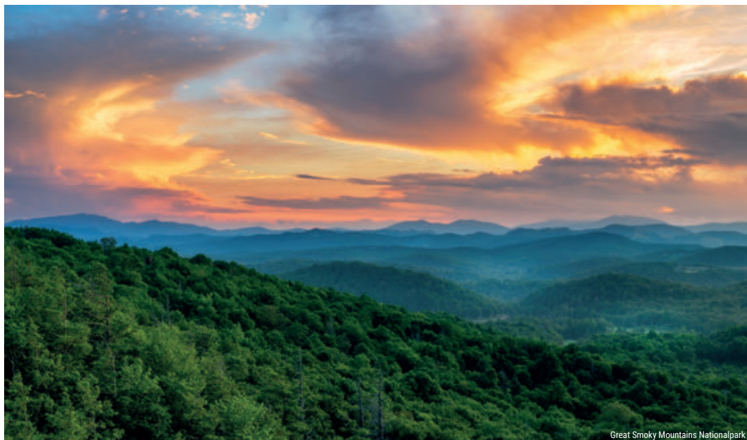
Great Smoky Mountains Nationalpark