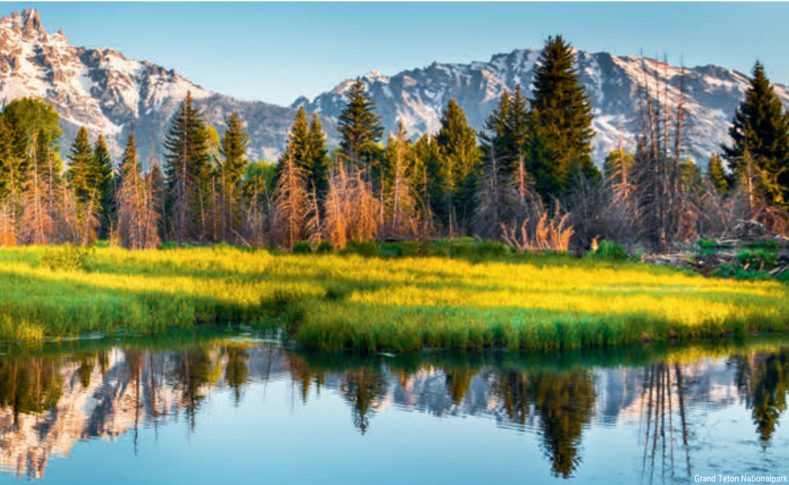
Grand Teton Nationalpark