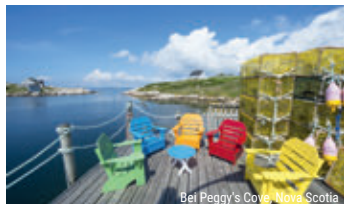
Bei Peggy's Cove, Nova Scotia