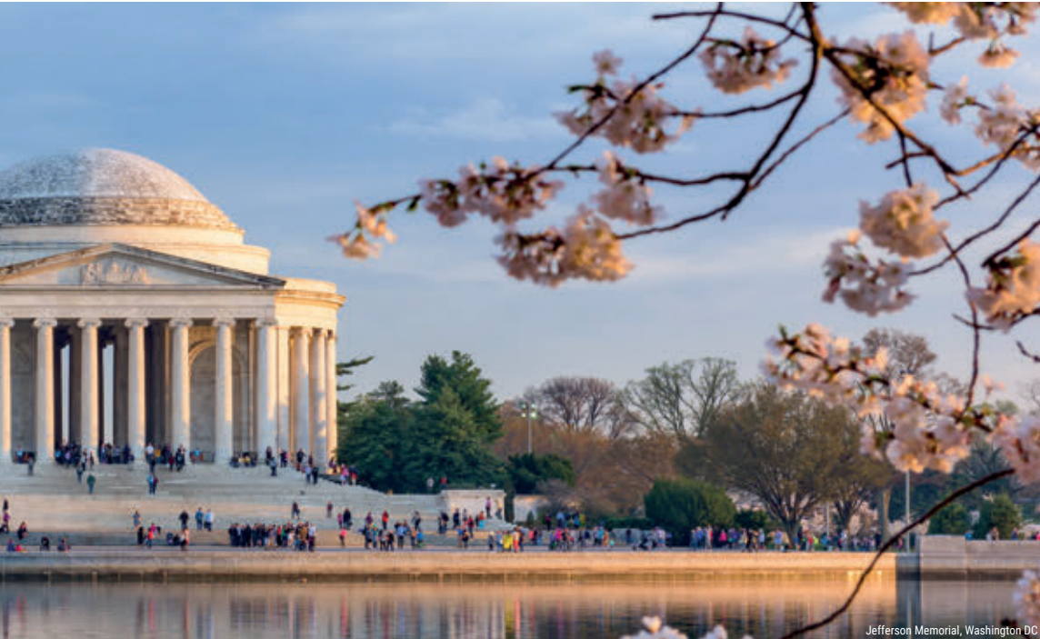
Jefferson Memorial, Washington DC