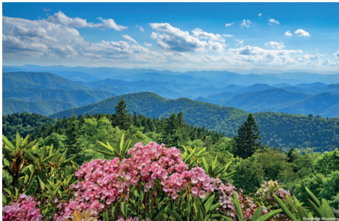
Blue Ridge Mountains

Einer unserer Geheimtipps für die USA. Sanfte Hügel, sonnige Strände und charmante Städtchen werden ergänzt durch historische Herrenhäuser sowie architektonische Denkmäler. Geniessen Sie eine Fahrt auf dem Blue Ridge Parkway entlang der Appalachen, machen Sie eine Wanderung im Shenandoah Nationalpark oder fahren Sie im Kajak entlang unberührter Küsten.