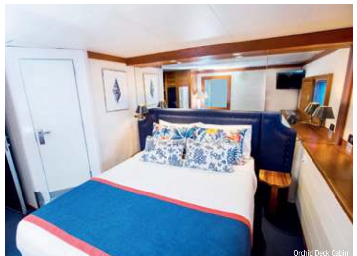
Orchid Deck Cabin