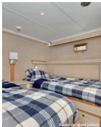
Kabine der Island Solitude

Die «Island Solitude» wird für die Great Bear Rainforest-Kreuzfahrten zwischen Bella Bella und Terrace eingesetzt, während die «Island Roamer» sowohl diese als auch die Khutzeymateen Valley-Route fährt. Die «Island Odyssey» hingegen unternimmt die Great Bear Forest-Fahrt mit Start- und Endpunkt Terrace.