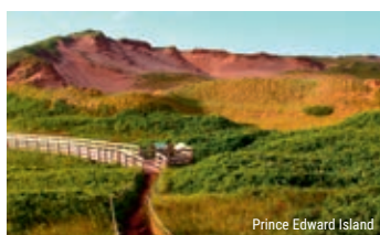
Prince Edward Island