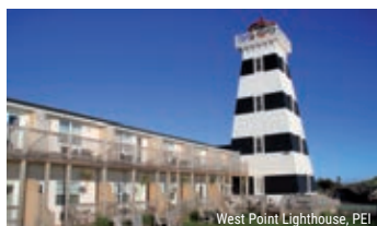
West Point Lighthouse, PEI