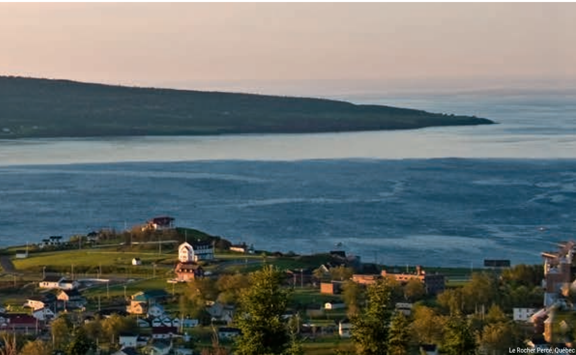
Le Rocher Percé, Québec