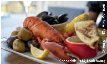
Spoondrift Café, Louisbourg