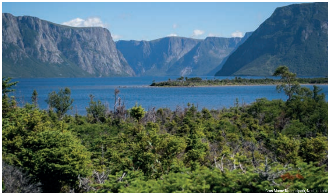
Gros Morne Nationalpark, Neufundland

Mit der Fähre setzen Sie nach Nova Scotia über und fahren zur Cape Breton Insel. Diese zeichnet sich durch eine faszinierende Hügellandschaft aus. 1 Nacht im L'Auberge Doucet Inn o.ä. (Kat. Standard) oder im Maison Fiset House o.ä. (Kat. Superior)