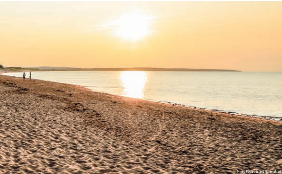
Prince Edward Island Nationalpark