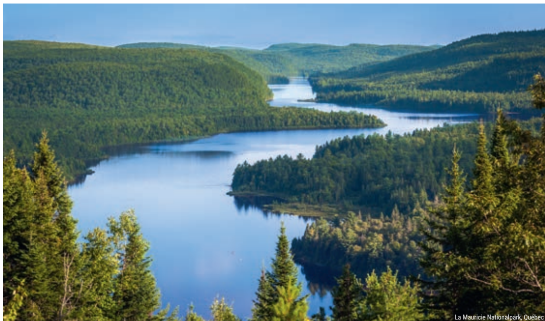
La Mauricie Nationalpark, Québec

Vielleicht machen Sie noch einen Stopp im Safari Parc Oméga in der Nähe von Montebello, bevor Sie sich in die kanadische Hauptstadt begeben. Ottawa fesselt mit geschichtsträchtiger Atmosphäre in den gotischen Gebäuden des Parliament Hills und wunderbaren Verflechtungen französischer und englischer Kultur. Die Stadt liegt am Ottawa River und verfügt über eine imposante Schleusenanlage. Neben dem Parlamentsgebäude, zählen einige hochkarätige