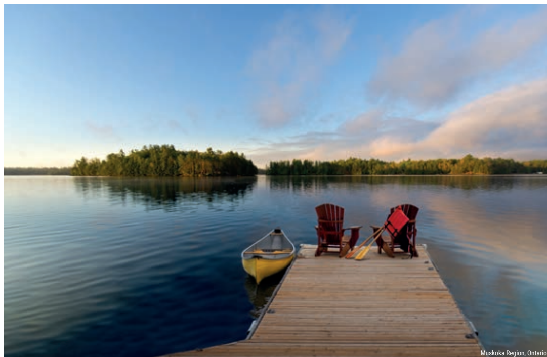
Muskoka Region, Ontario

Erkunden Sie die bekannten und weniger bekannten Attraktionen Ostkanadas auf gemütliche Weise und logieren Sie dabei in exklusiven Unterkünften, welche für ihre Lage, ihren Service und ein unvergessliches Erlebnis stehen. Die traumhafte Natur, die spannenden Städte sowie die kulinarischen Genüsse werden Sie begeistern.