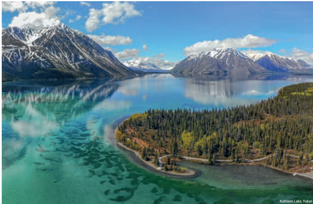
Kathleen Lake, Yukon

Eine Reise abseits der ausgetretenen Pfade! Der Yukon zählt noch zu den echten Geheimtipps für Naturliebhaber. Spektakuläre Strassen wie der Dempster Highway und der Top of the World Highway wechseln sich ab mit Gletschern, reichem Tierleben, Westernstädtchen und echten Wildnis Outposts. Entspannung finden Sie im traumhaften Southern Lakes Resort.