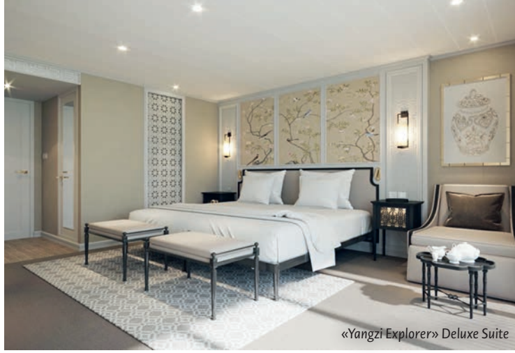
«Yangzi Explorer» Deluxe Suite